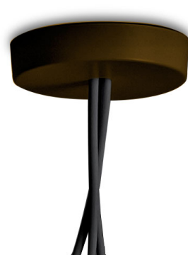
F0093026 Vielfach Rosette - Eloxiertes braun