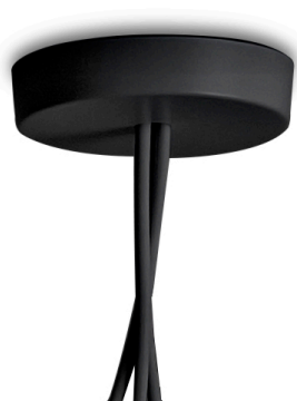
F0093030 Vielfach Rosette - Schwarz