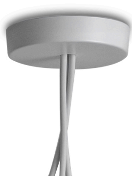
F0093009 Vielfach Rosette - Weiß